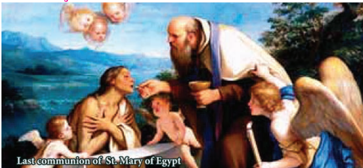
Last communion of St. Mary of Egypt

Our Lady of Perpetual Succour Saturday | After 9:30 AM. Mass