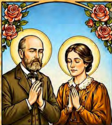
A family that prays together